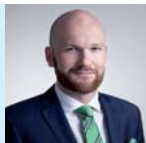
Dr Jędrzej Bujny SMM Legal Maciak Mataczynski Adwokaci sp.k