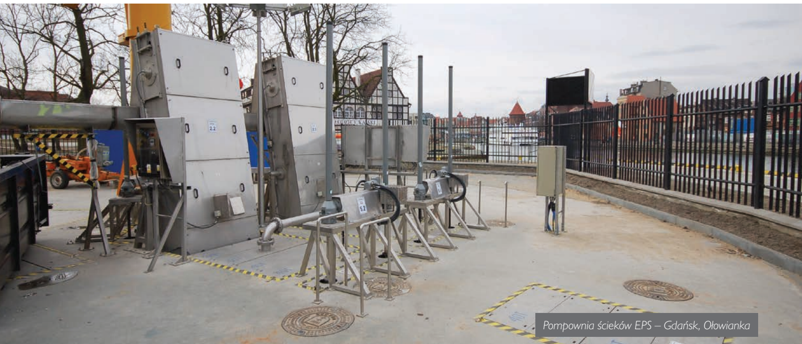
Pompownia ścieków EPS – Gdańsk, Ołowianka