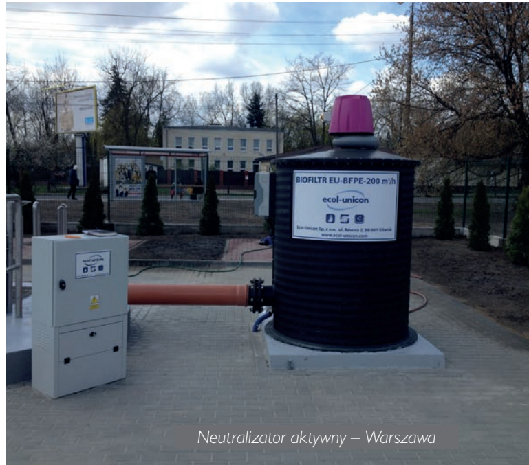
Neutralizator aktywny – Warszawa